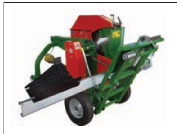
705.V.PF / ST