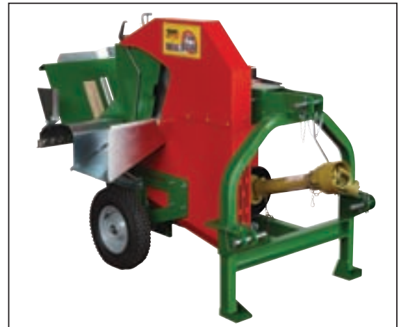
705.V.PF / ST