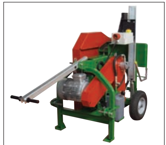
705.3812 / ID